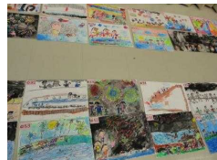
川内美術協会の先生方による審査風景

審査の先生方は、「みなさんの絵を見ていると、この風景が好きという気持ちがとても伝わってきますね。私たちもこんな風に描けたらいいな。」と高く評価しておられました。これからも、この素晴らしい風景を大切にしていきたいですね。