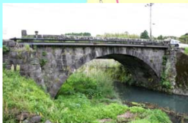
かみゆだばし せんだい ③上湯田橋(川内)