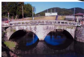
えのくちばし せんだい ⑩江之口橋(川内)