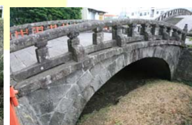
こうらいばし せんだい ⑪降来橋(川内)