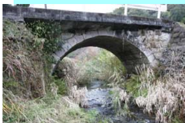
にしかわうちばし せんだい ②西川内橋(川内)