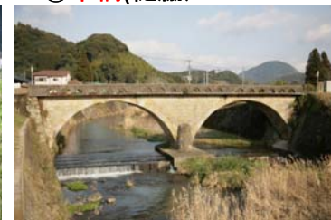
しんたいばし いりき ⑦新大橋(入来)