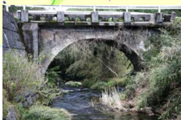
みゆきばし ひわき ④幸橋(樋脇)