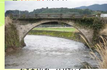
なるきだばし けどういん ⑨成木田橋(祁答院)