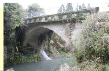
いわもとばし とうごう ⑧岩元橋(東郷)