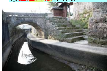
きはらばし せんだい ①木原橋(川内)