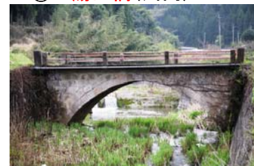
まつおばし いりき ⑥松尾橋(入来)