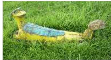
レガッタハウス横