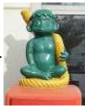
川内駅前 (郵便ポスト上)