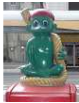
西向田町 (郵便ポスト上)