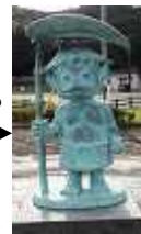
田海導水記念公園