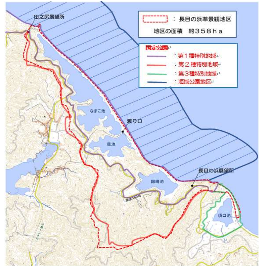
図表 1 4 長目の浜準景観地区指定範囲