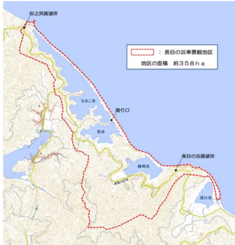
図表 1 4 長目の浜準景観地区指定範囲