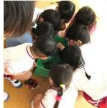
【自然との関わり・思考力の芽生え】

小さいカニを見つけてみんなて観察しました。「なんで 赤いの?」「ハサミで指をはさまれたら痛いわ。」「何を食べるのかな?」などと、いっぱいお話がひろ