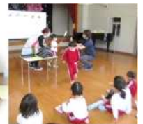
【社会とのかかわり・数量や図形、標識や文字などへの関心・感覚】