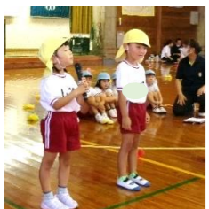
かけっこでは名前を言ってから、かっこよく走りました。

9月23日(土)に亀山幼稚園の“げんきまつり”(運動会)を開催いたしました。今年度は、天候不良による順延等をしないで済むように、薩摩川内市少年自然の家プレイホールを借りての室内実施といたしました。初めての試みでしたが、今回の亀山幼稚園の“げんきまつり”は『みんなで楽しく』をモットーに、かけっこ、ダンス、リレー、親子競技等、工夫をこらして取り組んでみました。いかがだったでしょうか?お陰様で、大きな怪我もなく、みんな笑顔??で楽しむことができました。(年少さんたちはいつもと違う雰囲気や人の多さにびっくりして、号泣する場面もありましたが……)無事に終わって、バンザーイ!です。