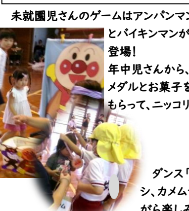
未就園児さんのゲームはアンパンマンとバイキンマンが登場!年中児さんから、メダルとお菓子をもらって、ニコリ