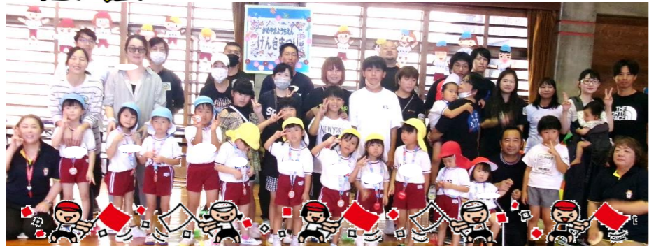
【健康な心と体】【協同性】【自立心】【社会生活との関わり】【道徳性・規範意識の芽生え】【言葉による伝え合い】