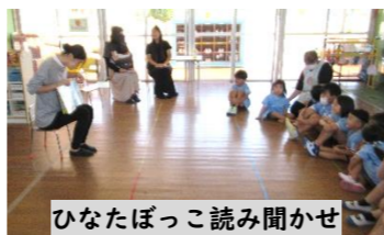
ひなたぼっこ読み聞かせ