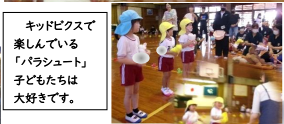
キッドピクスで楽しんでいる「パラシュート」子どもたちは大好きです。