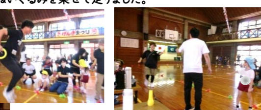
「園児対保護者対抗リレー」は保護者がハンデとしてジャンプをしてから走ります。接戦でしたが、最後は子どもたちチームが勝ちました。お疲れ様でした!