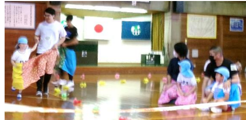
親子で「デカパンでレツトライ!」のんびり、ゆっくりgo! go!