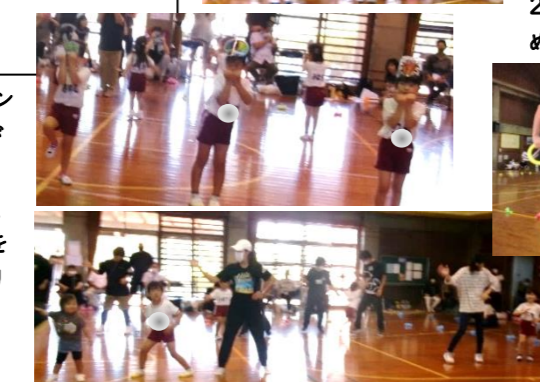
ダンス「昆虫太極拳」決めポーズはカマキリ、バッタ、ダンゴムシ、カメムシのポーズ!親子ダンスはネコとネズミになって遊びながら楽しみました。