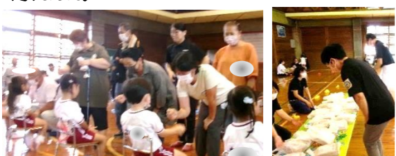
祖父母・来賓の「ジャンケンポンで宝探し」は子どもたちとジャンケンをして勝ったら、お宝ゲットでした。