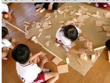
木工遊び 木ぎれで何ができるのかな? 触って、積んで、動かして! いっぱい考え中

【思考力の芽生え】【社会生活との関わり】【言葉による伝え合い】【協同性】【数量や図形などへの関心・感覚】