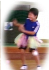
小・中学生の「走ってフラダンスでショー」踊ってくれて、ありがとう!