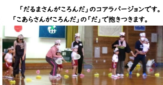
「だるまさんがころんだ」のコアラバージョンです。「こあらさんがころんだ」の「だ」で抱きつきます。