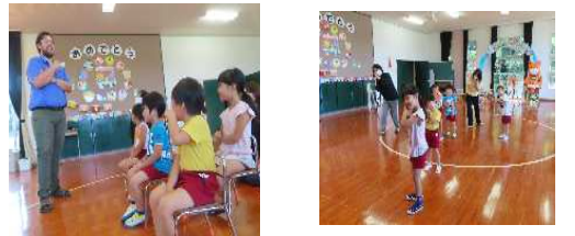
【言葉による伝え合い】