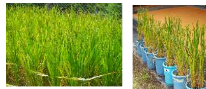
【豊かな感性と表現】