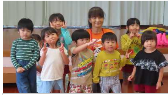
キッドビクスの先生とにっこり(^_^)