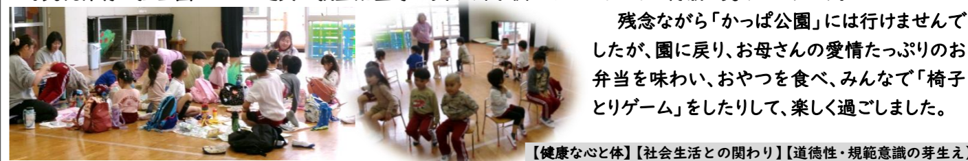
【健康な心と体】【社会生活との関わり】【道徳性・規範意識の芽生え】

交流保育・遠足日は雨でした。でも城上幼稚園に行って、たくさんの遊具や友達と汗びっしょりになって、楽しく遊びました。城上幼稚園は一部屋と絵本の畳部屋があるだけですが、亀山幼稚園にはない遊具があり、みんな飛びついていました。交流保育は担当園によって遊具や教室配置等が異なり、子供たちはいろいろと刺激を受けるようです。