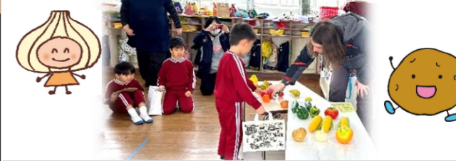
【社会生活との関わり】【数量や図形、標識や文字などへの関心・感覚】

今回のテーマは「お買い物ごっこ」でした。いろいろな果物や野菜の名前を英語で教えてもらった後、「バナナ プリーズ」と言いながら、お金を払い、最後は「Thank You」「バイバイ」と言いながら、お買い物のやり取りを楽しみました。マックス先生が一人一人に丁寧に声掛けをしてくださったので、子供たちはリラックスして楽しむことができました。3回のお買い物で、「ポテト」「オニオン」「コーン」をゲットした男児は「今日はカレーを作るよ」とちゃんとメニューを決めていました。