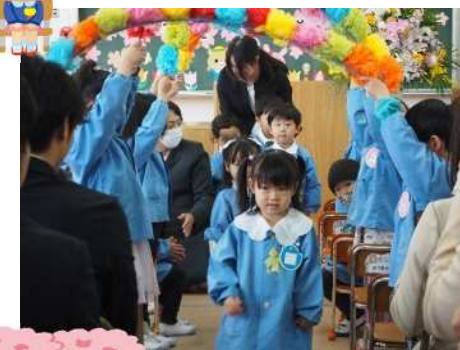
お花のトンネルから入場