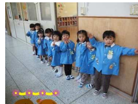
入園式後にみんなで