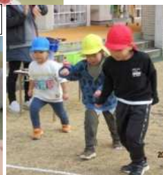
どんぐりマラソン