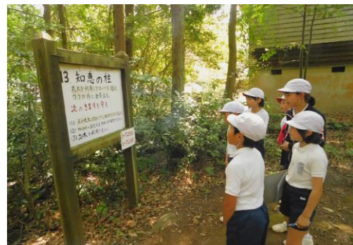
チームワークゲーム