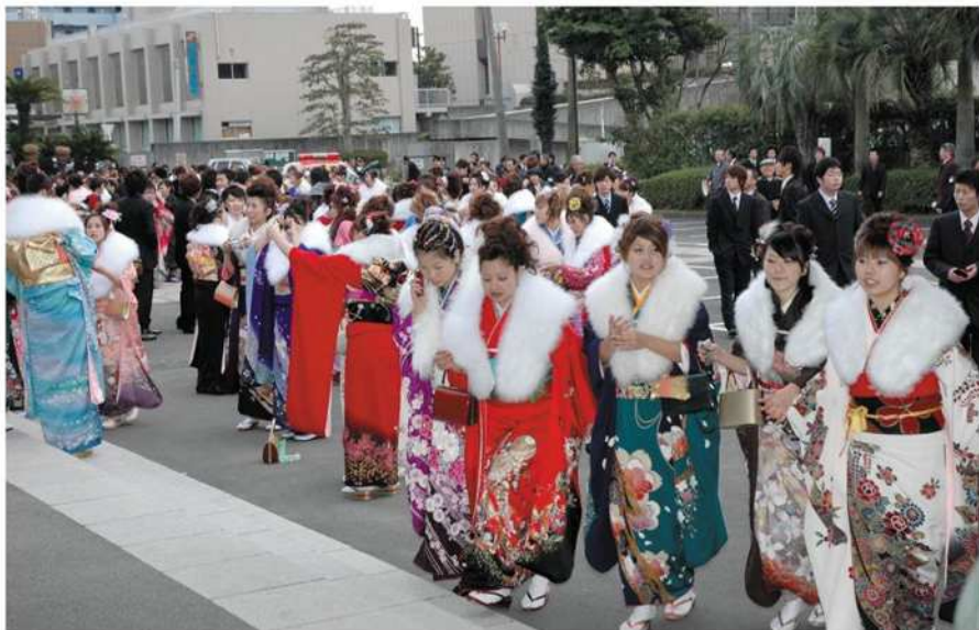
成人式 1月8日(月) 川内文化ホール