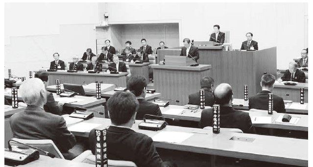
議長選挙の所信表明演説