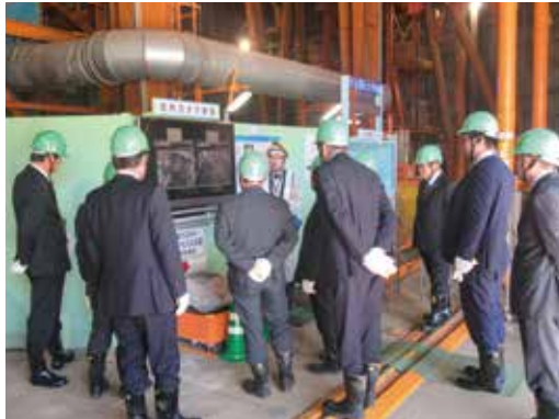
東濃地科学センター瑞浪超深地層研究所