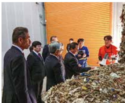
バイオマス資源化センターみとよ

【新見医師会 岡山県新見市】 【バイオマス資源化センターみとよ 香川県三豊市】 【兵庫県姫路市】