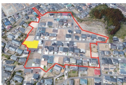
R4.3.11 時点の川内権現原土地区画整理の事業区域（赤）及び御陵下権現原公園の位置（黄）

「薩摩川内市普通公園条例の一部を改正する条例の制定について」は、原案のとおり可決しました。