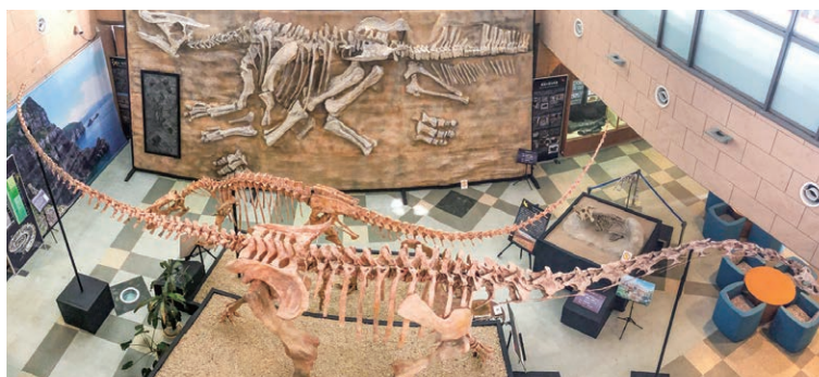
甌ミュージアム恐竜化石等準備室の骨格標本

甌島を中心とする自然史に関する資料の収集・保管・展示調査研究並びに教育活動を通して、自然の生い立ちや郷土の豊かな自然環境に関する市民の教養を育み、学術・文化の発展に寄与するため薩摩川内市甌ミュージアムを設置しようとするもの