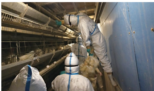
防疫作業における鶏の捕獲作業

出水市における高病原性鳥インフルエンザ発生に伴う防疫作業等支援により、時間外勤務手当及び旅費が不足するため、増額するもの