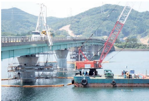
過去の河口大橋耐震補強工事

道路メンテナンス事業川内河口大橋耐震補強(P3)工事について、工事請負契約を締結しようとするもの