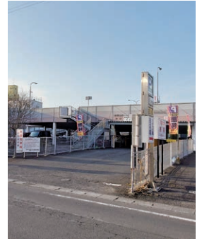
市営横馬場駐車場