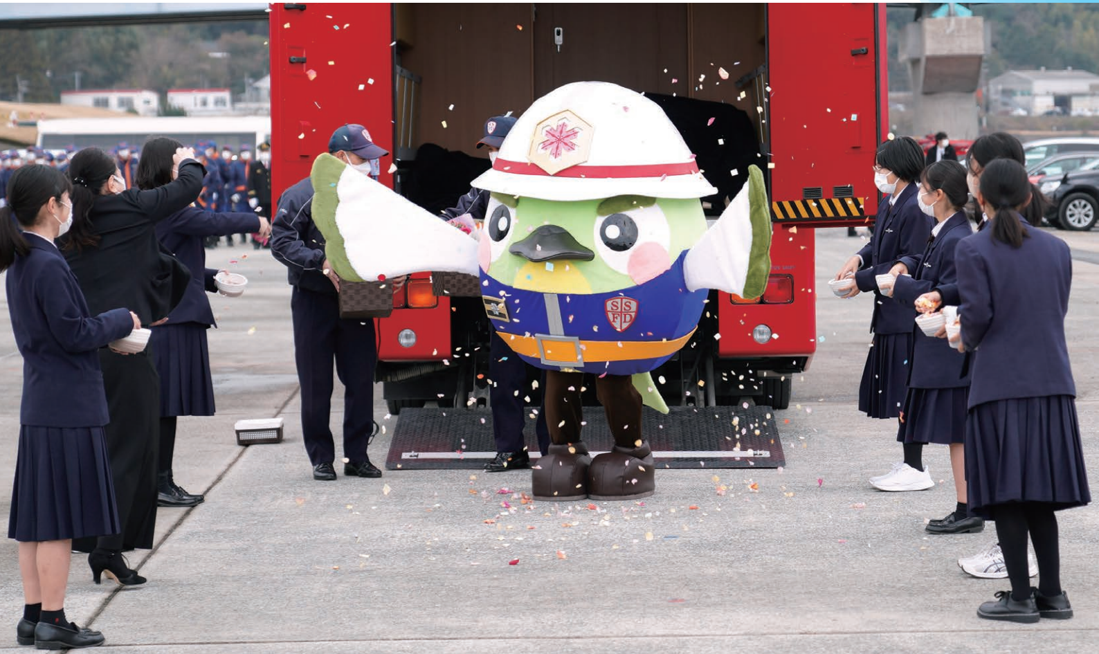
薩摩川内市消防局マスコットキャラクター「ユリハナ君」の初お披露目 (1月7日消防出初式)