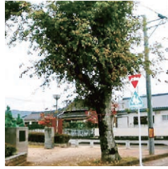
泰平寺公園入口の樹木(剪定前)

答 都市公園である泰平寺公園の樹木には、日差しを防ぐ等の役割がある。現状、該当樹木に倒木の危険が確認できないため、通行、標識に支障がないよう、枝の剪定で対応する。今後も、地域のご意見を聞きながら対応していきたい。