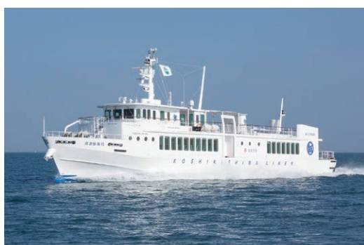
無償貸与される高速船甌島

本市が所有する船舶について、運航事業者に無償貸付する期間が満了することから、引き続き無償貸付しようとするもの ・ 貸付する財産／高速船甌島 ・ 貸付の相手方／甌島商船株式会社 ・ 貸付の期間／令和5年4月1日～令和10年3月31日