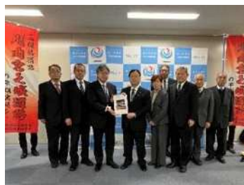
令和8年2月国への要望活動