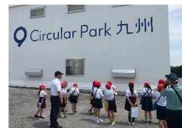
サーキュラー研修の様子