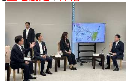
首相官邸での車座対話の様子