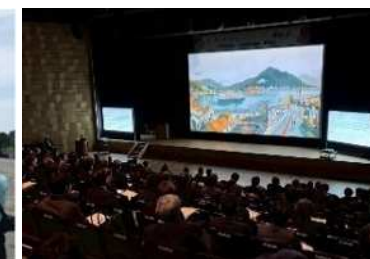
Circular Challenge Week in 薩摩川内の様子