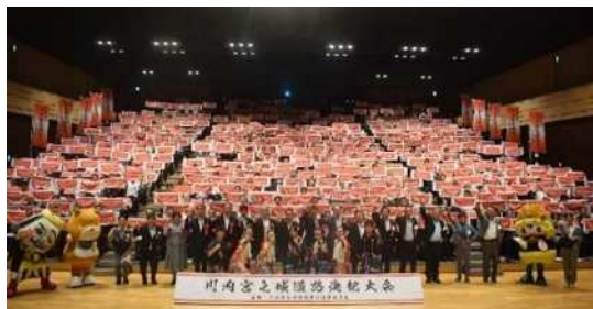
令和7年8月決起大会