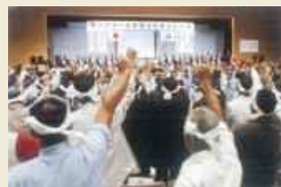
【平成18年10月7日】 サンアリーナせんだいでの決起大会で早期完成へ氣勢をあげる参加者