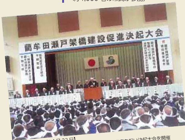
【平成18年4月22日】 本市鹿島町の鹿島小学校体育館で事業着手発表を祝い決起大会を開催