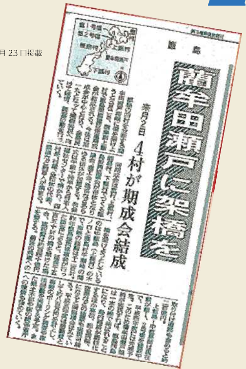
南日本新聞 平成3年2月23日掲載

さらに、将来への甌島の発展を期する中で、甌三島を結ぶ縦貫道実現のため、黒浜～蘭牟田間すなわち、蘭牟田瀬戸の早期県道認定と併せて、架橋の建設を促進していただきますようお願いいたします。