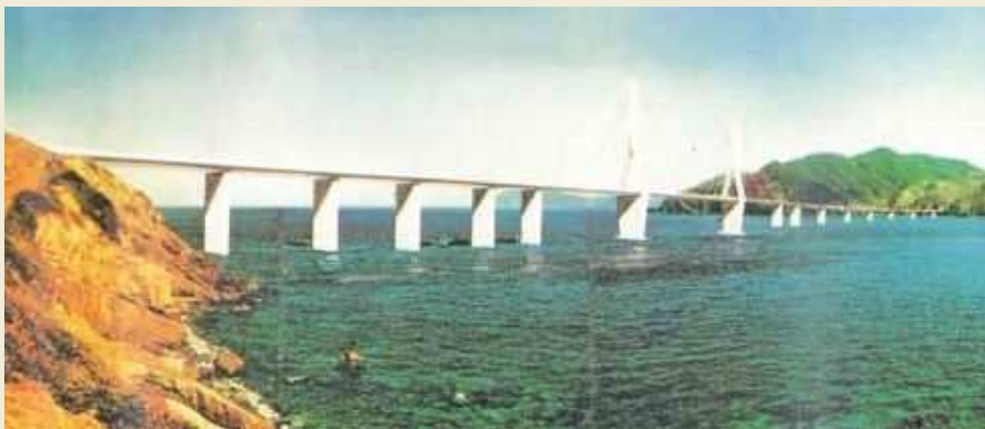
コンピュータグラフィックによる藺牟田瀬戸大橋完成予定図