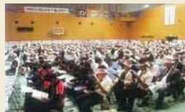
【平成18年10月7日】 蘭牟田瀬戸架橋にかかる習字・図画等の作品や大漁旗、のぼり旗、横断幕を掲げ甌島一色となったサンアリーナせんだいでは約1,000名の市民が参加