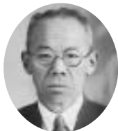
17代村長・初代町長 昭和13年5月～昭和17年5月 山下 開吉