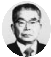
12・13・14代 昭和49年9月28日～昭和59年1月26日 福壽十喜