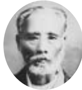
2・3代 明治26年6月～明治31年1月 菊池 武國