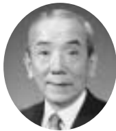
15・16・17代 昭和59年3月11日～平成8年3月10日 仁禮國市