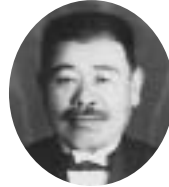
12・13・14・15代 大正10年11月～昭和9年4月 松元 直市