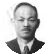
5代 昭和22年11月～昭和26年11月 久目形 早市