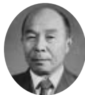
9・13・14・15代 昭和34年6月15日～昭和38年4月29日 昭和50年5月6日～昭和59年8月1日 石原 秀志