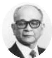
26・27・28・29・30・31代 昭和40年10月12日～平成元年10月11日 上村 清尚