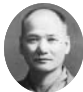
9代 大正10年9月19日～昭和4年4月25日 大山 岩城