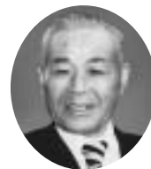
12代 昭和46年5月8日～昭和50年4月29日 梶原 盛勝