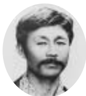
2・4代 明治29年2月10日～明治32年2月9日 明治34年12月10日～明治36年6月2日 原田 準熊