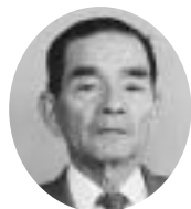
10・11・12・13代 昭和46年5月7日～昭和62年4月29日 東武一