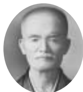
3・4・7・8・11代 明治32年8月～明治38年10月27日 明治43年8月～大正4年9月 大正8年2月17日～大正14年6月6日 上村 菊太郎