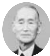
14代 昭和18年9月8日～昭和20年9月6日 岸 光憲