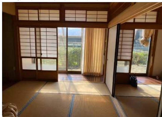
和室6帖 (床の間側) ~ (玄関側)