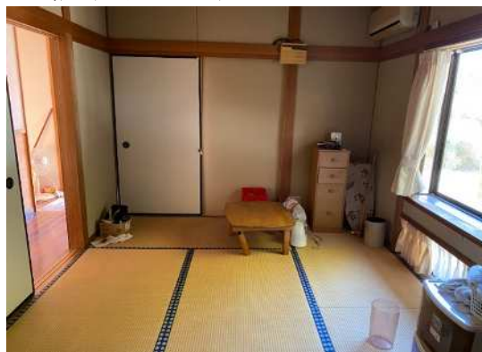
和室6帖 (キッチン側)