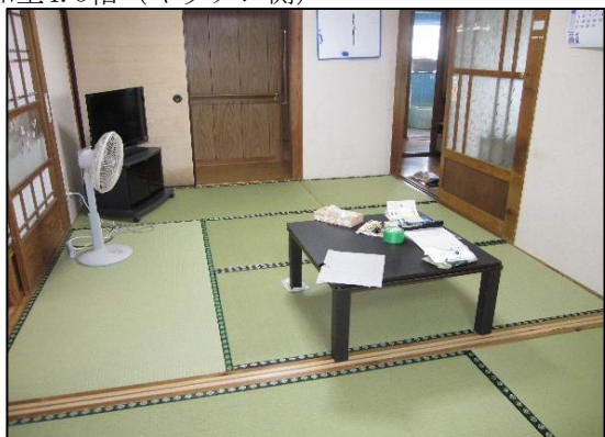
和室4.5帖（キッチン側）