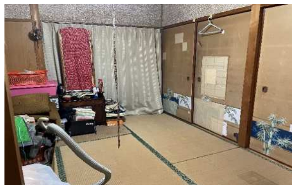
和室6帖（キッチン横）