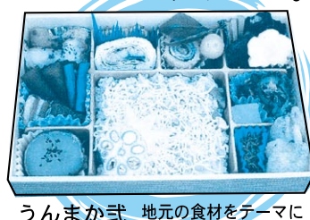
うんまか式 地元の食材をテーマに (2) お造りしました。

旬の素材を取り入れるため季節によりメニューが一部変更になる場合がございます。ご了承下さい。