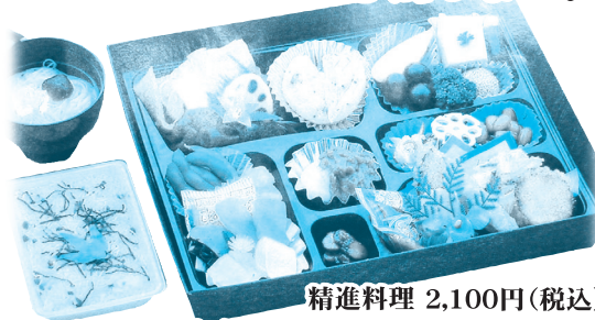
精進料理 2,100円(税込) 数に限りがございますのでご予約はお早めに。

お盆料理のご予定はお決まりでしょうか？ すべての材料に真心をこめた精進料理を... ご予約承り中！！