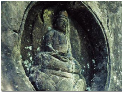
法界定印をした像は、日本に一つしかない貴重な遺跡です(小路磨崖仏)。

が多く、ベッドタウンとしてのにぎわいを見せています。川内川流域の自然豊かな地に「フルーツの里」「安全・安心」「学びあう」などを目標に掲げ、自然輝く斧淵づくりを目指して活動しています。夏はブドウ、秋はナシ・ミカン、冬はイチゴと四季折々の甘い果物も楽しめますよ。 斧淵地区コミュニティ協議会では、「人・心・自然あふれる斧淵をテーマに、一人一人が自覚し、一人一人が創り、一人一人が育み、交流躍動する地域として、まちづくりの目標や基本方針を定め、次の四つのゾーンを設けて地域振興を図っています。 ①農(食)住・いきいきゾーン ②うめーふれあい(交流)ゾーン ③諏訪わくわく学習体験ゾーン ④文弥節人形浄瑠璃ゾーン これらのゾーンを生かしながら地域活性化を図り、地区協議会の自立・自興を心がけて活動していきます。