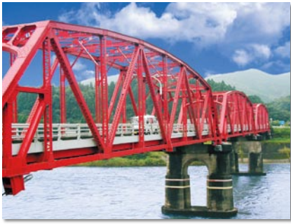
地区住民に、長年親しまれている東郷橋(通称:赤橋)。斧淵地区の赤いシンボルです。

さて、斧淵地区は、幼稚園、小・中学校、商店街、東郷温泉「ゆったり館」などがある東郷地域の中心にあり、世帯数1422世帯、人口3682人、高齢化率24.5%と各年代のバランスがとれている地区です。また、急速な少子・高齢化が進む中で、平成5年から定住促進事業により地区以外からの移住者