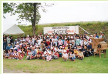
子どもたちも楽しめる「おのぶち塾」

地区の世代間交流事業を「おのぶち塾」として開催し、これまで「昔ながらの農機具を使い、三世代一緒になって体験する菜種おとし」、「小学校の緑門づくり」、「夜空を彩るイルミネーションの設置」などを行っています。そのほかに、地区球技大会やラジオ体操大会・東郷地域パトロールを行い、安全・安心な地域づくりに取り組んでいます。