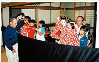
全身で踊りながら人形を操ります。

■問合先 斧淵地区コミュニティ協議会 ■所在地 〒895-1106 東郷町斧淵 299-6 ☎0996(42)0864