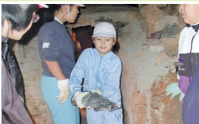
完成した手作りの炭を運び出す小学生

■問合せ 吉川地区コミュニティ協議会 ■所在地 〒895-0213 城上町 8292 ☎・FAX 0996(30)2810