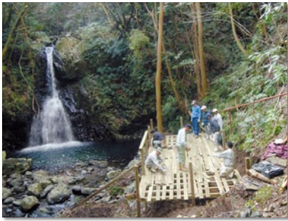
地区住民の有志で整備を進める様子。高城川上流の「そばどんの滝」にて

さて、吉川小学校全児童は19人で、このうち5人が地元の児童です。そのほかの児童は平成13年度から始まった特認校制度を利用し、保護者の十分な理解を得ながら本地区外の自宅から1年間スクールバスで通っており、当