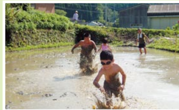
田んぼで遊ぼう!!みんな楽しそうです。