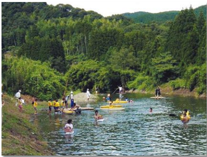
自然を満喫!! ドキドキ川遊びは、手作りいかだとカヌー体験で楽しめます。

初1人の児童を受け入れて以来、一人一人が主役で自然・体験・感動いっぱいと呼び掛けるチラシ配布などにより現在14人と増加しています。兄弟や複数年、さらには6年間在籍し通学した児童もいます。