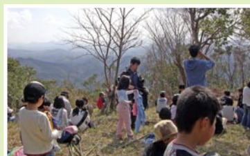
混岳登山は幼児から高齢者まで参加

また、特筆すべきは地区内の治安のためにパトロール隊「あなたを守り隊」を結成しました。青色パトロール車3台で巡視し、地区内が安全で安心して暮らせる地域づくりのために活動し頑張っています。