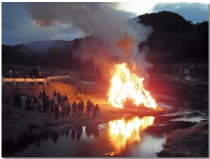
1年間の無病息災と子どもたちの健やかな成長を願って行く「鬼火たき」

清流く高城川くでの夏場の川遊び、カジカガエルの鳴き声とともに、ホタルの乱舞する風光明媚で自然・環境がとて豊かな城上地区を紹介いたします。