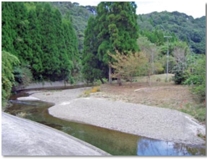
地区の真ん中を流れる高城川。ほかの地区からも家族などが遊びに訪れる。

さて、地区の特徴として、町内が上城上(吉川小学校区)と下城上(城上小学校区)に分割されている点です。従って、同じ町内に吉川地区コミュニティ協議会と城上地区コミュニティ協議会の二つの組織があり、また、その