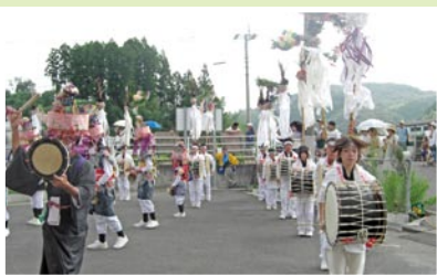
伝統文化を受け継ぐ「太鼓踊り」

■問合先 城上地区コミュニティ協議会 ■所在地 〒895-0213 城上町3697-1 ☎0996(30)1068