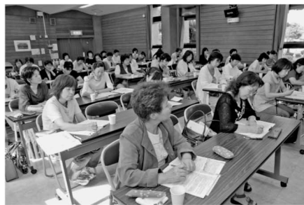
男女共同参画の視点に立った地域づくり をテーマとした研修会の実施状況