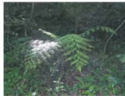
ヘゴ自生北限地帯