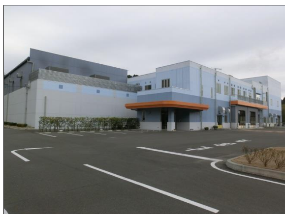
川内汚泥再処理センター