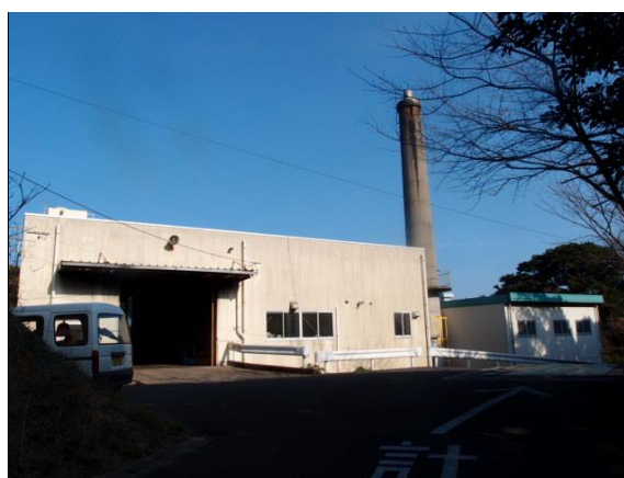
下甌クリーンセンター