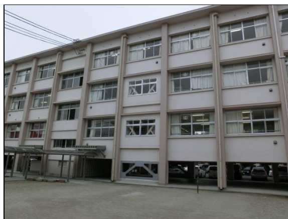
川内北中学校（耐震補強工事済み。）