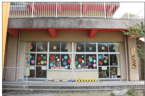
かのか幼稚園 鹿島分園