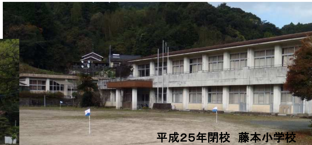
平成25年閉校 藤本小学校