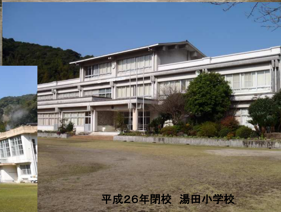
平成26年閉校 湯田小学校