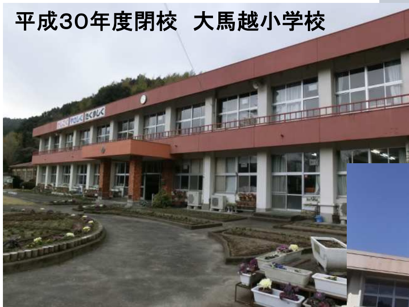
平成30年度閉校 大馬越小学校