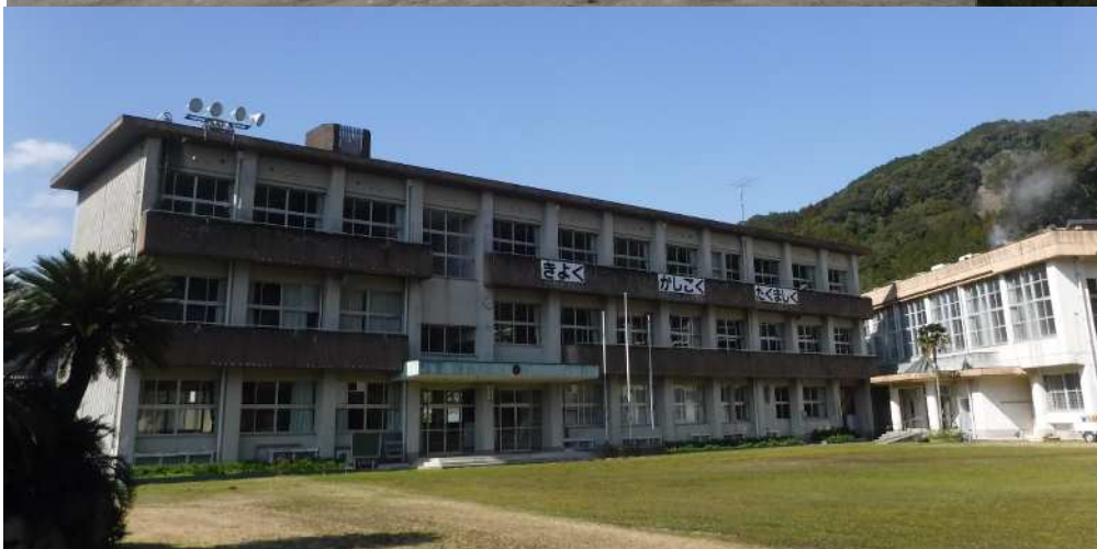
平成29年閉校 藤川小学校