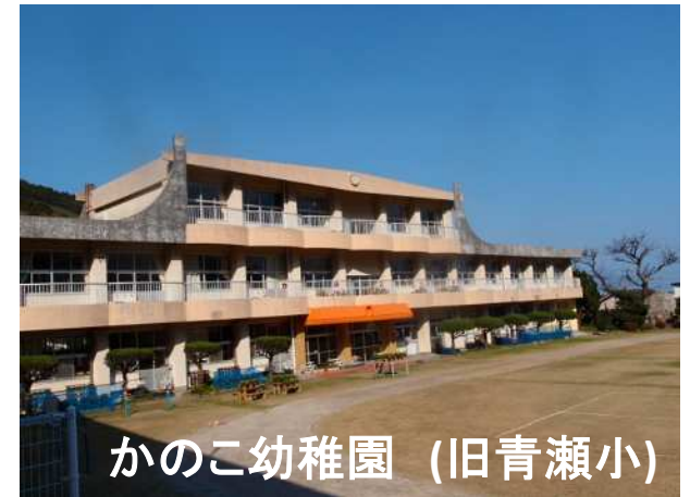
かのこ幼稚園 (旧青瀬小)