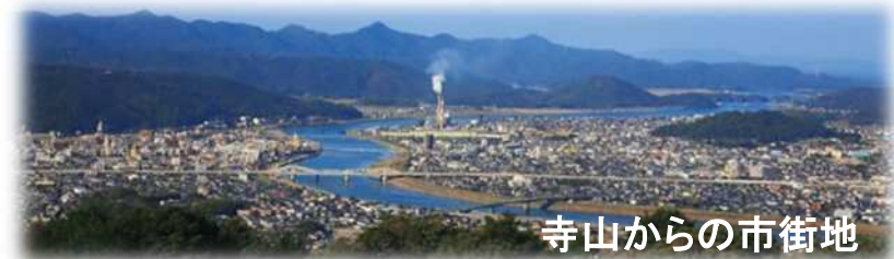
寺山からの市街地