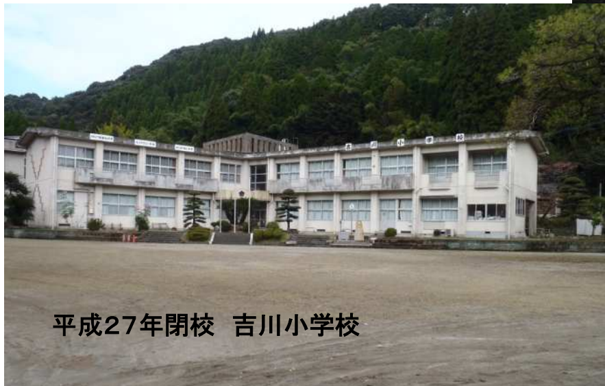
平成27年閉校 吉川小学校