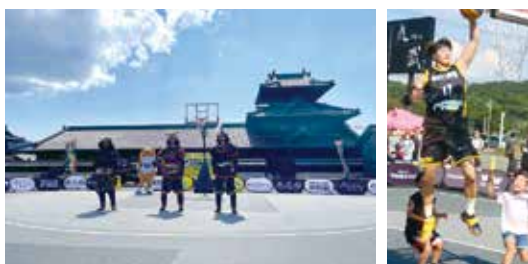
▲コートは11月20日(土)まで設置予定で、一般無料開放されています。

9月20日(月)、甲冑工房丸武で、東京2020オリンピックで実際に使用された3人制バスケットボール3x3のコートのお披露目会が行われました。当日は、コートを所有するプロチーム「EXPLORERS KAGOSHIMA.EXE (エクスプローラーズ鹿児島)」の選手が甲冑姿で登場し、子どもたちと対戦するなど会場を盛り上げました。